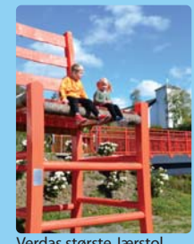
Verdas største Jærstol