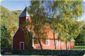
Årdal gamle kyrkje