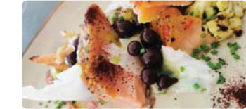
Laks og frukt, lekkert og lokalt

kristen.birkemo@gmail.com Tlf 913 59 131. Utleige av kontor